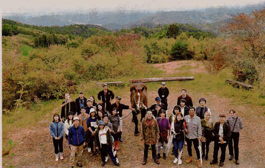
ワークショップで石川町を訪れた留学生ら