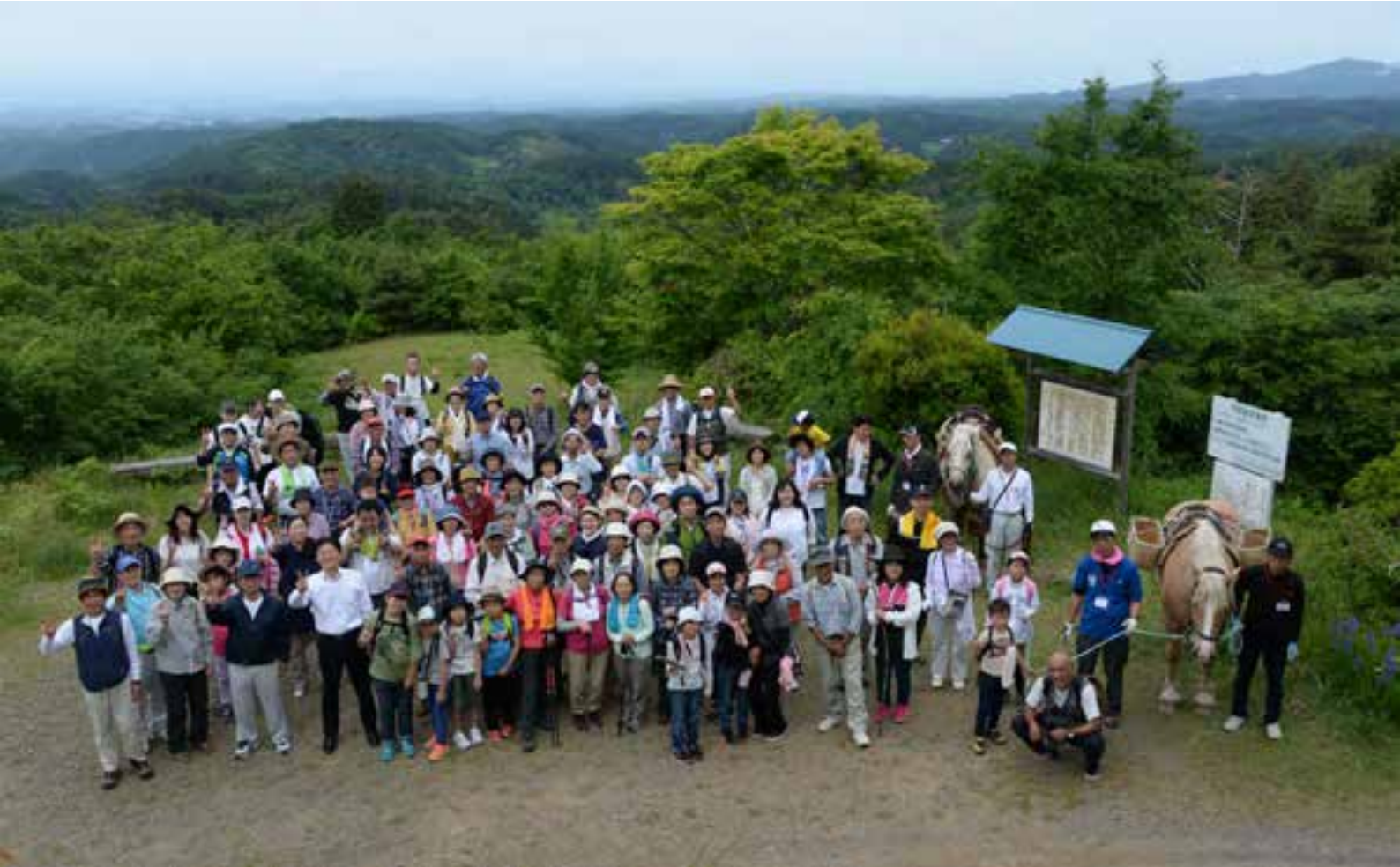
山の眺めが良い二本ブナでの休憩と参加者の集合写真

Group photo of participants and a break in Nihonbuna with scenic mountain views